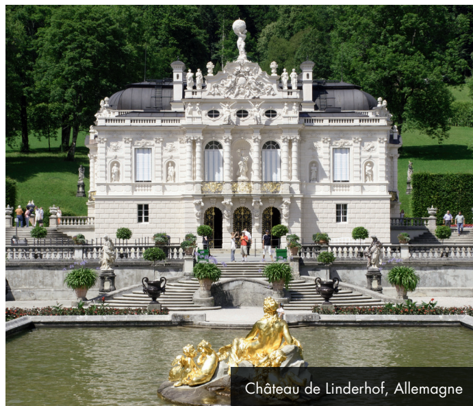
Château de Linderhof, Allemagne