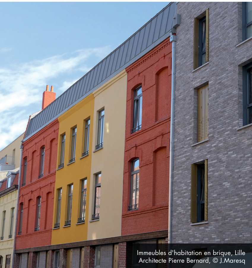
Immeubles d'habitation en brique, Lille Architecte Pierre Bernard, © J.Maresq