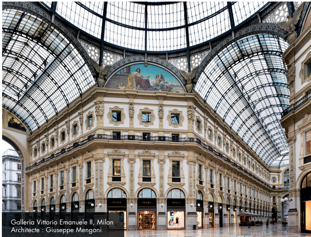
Galleria Vittorio Emanuele II, Milan Architecte : Giuseppe Mengoni