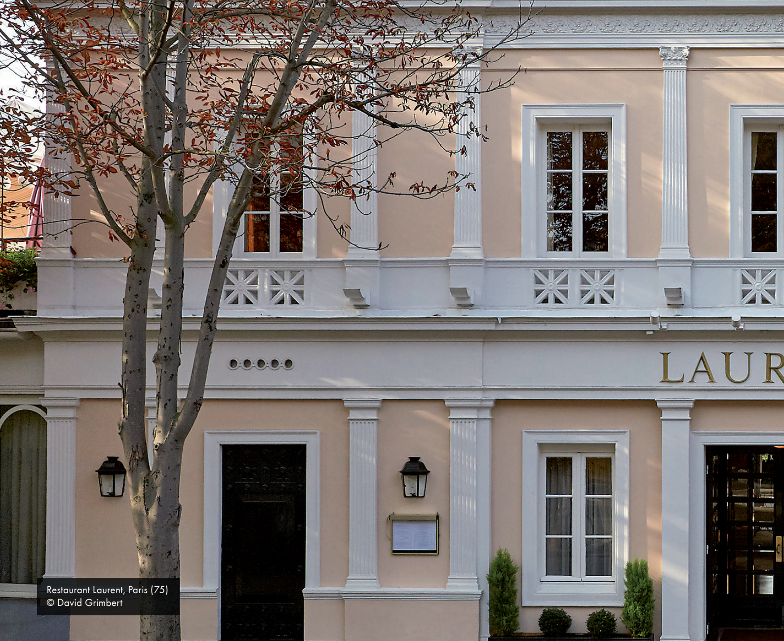
Restaurant Laurent, Paris (75)