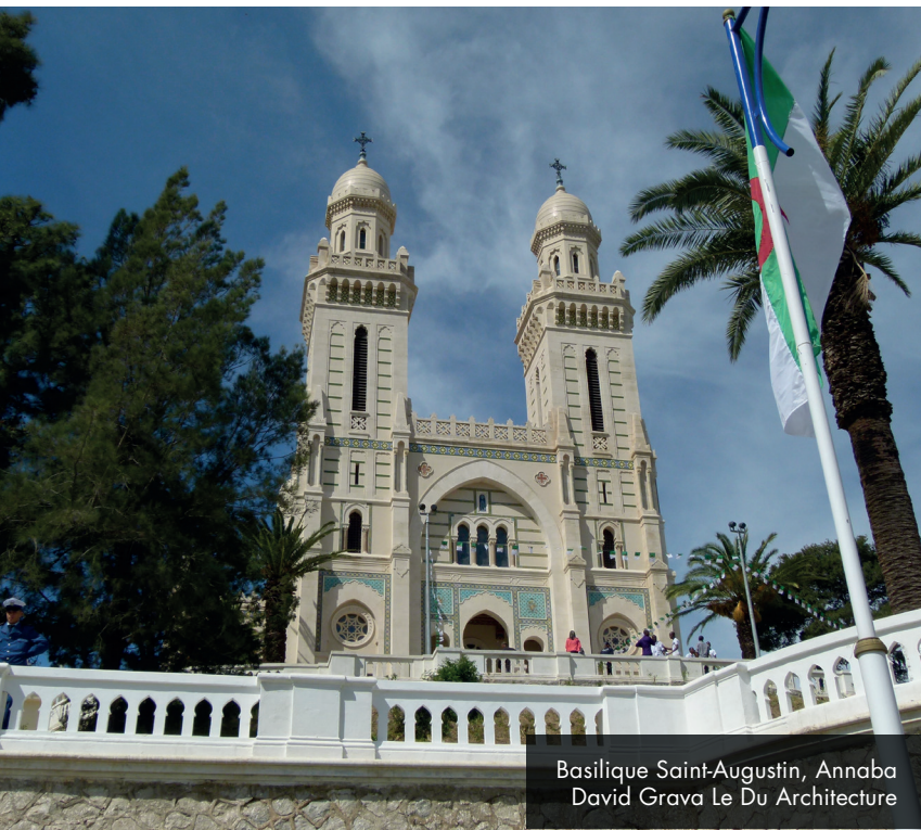
Basilique Saint-Augustin, Annaba David Grava Le Du Architecture