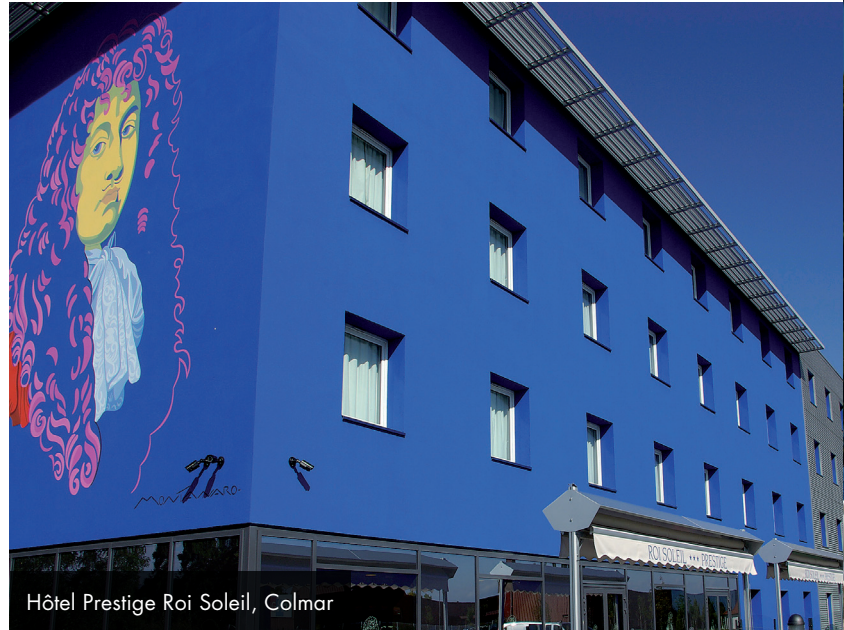
Hôtel Prestige Roi Soleil, Colmar