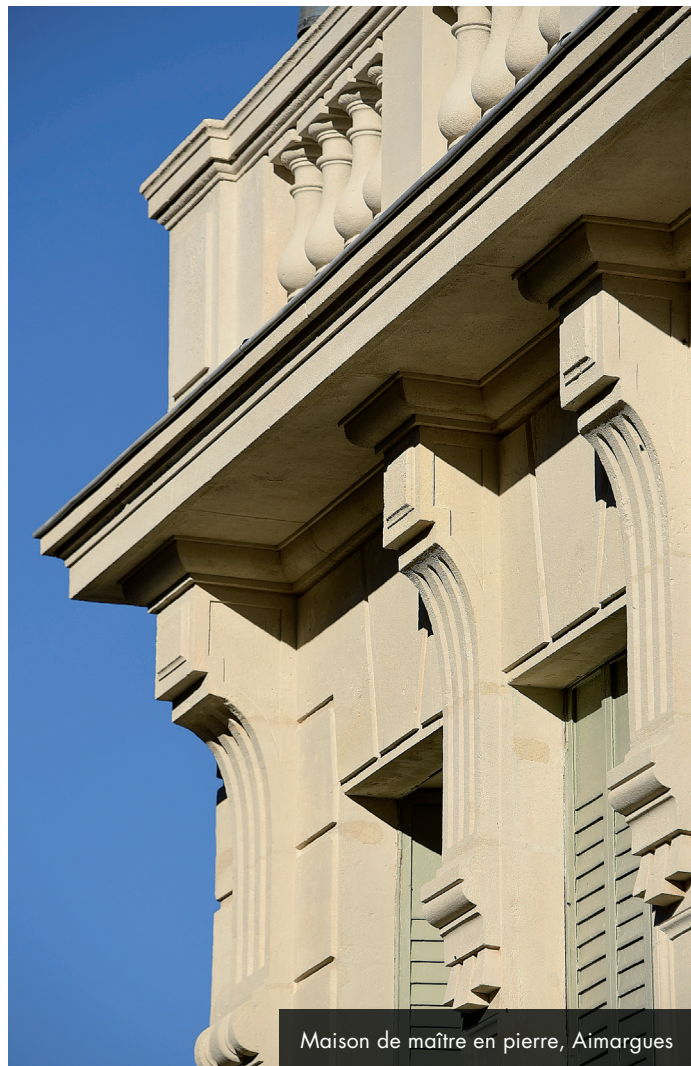
Maison de maître en pierre, Aimargues