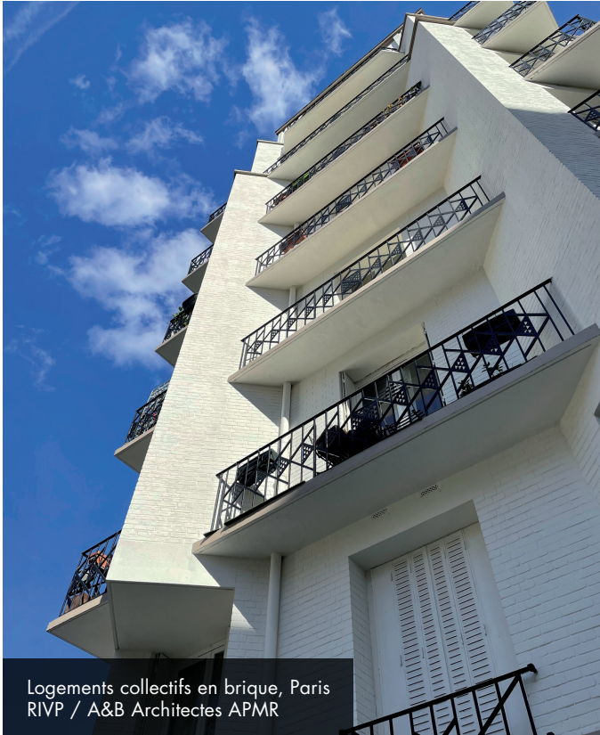
Logements collectifs en brique, Paris RIVP / A&B Architectes APMR